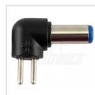
ø5,5 - 2,1mm