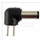
ø5,5 - 2,5mm