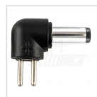
ø3,5 - 1,35mm